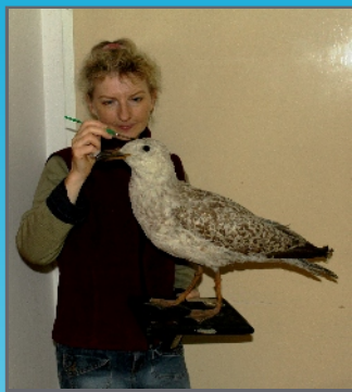
obr. k článku Krása všední činnosti