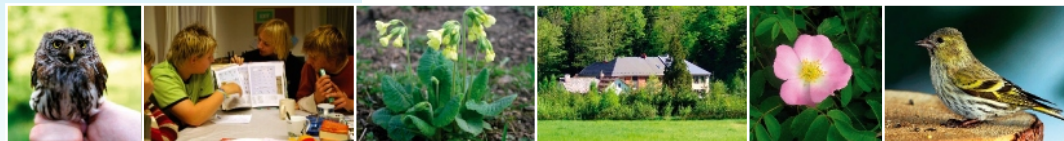
Graf. úprava: Richard Hrádek a Filip Laštovic