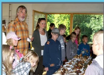
Houbařská výstava na ekocentru Krupárna byla navštívena několika školami